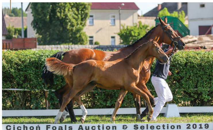
Cichoń Foals Auction & Selection 2019

Każda z tych matek to przemyślane skojarzenie, które jest wynikiem ciężkiej pracy i wieloletniego doświadczenia. Fundament naszej hodowli tworzą konie ras rodzimych, które w połączeniu z zachodnimi reproduktorami dały rzeszę wspianego potomstwa, odnoszącego sukcesy sportowe w kraju i za granicą.